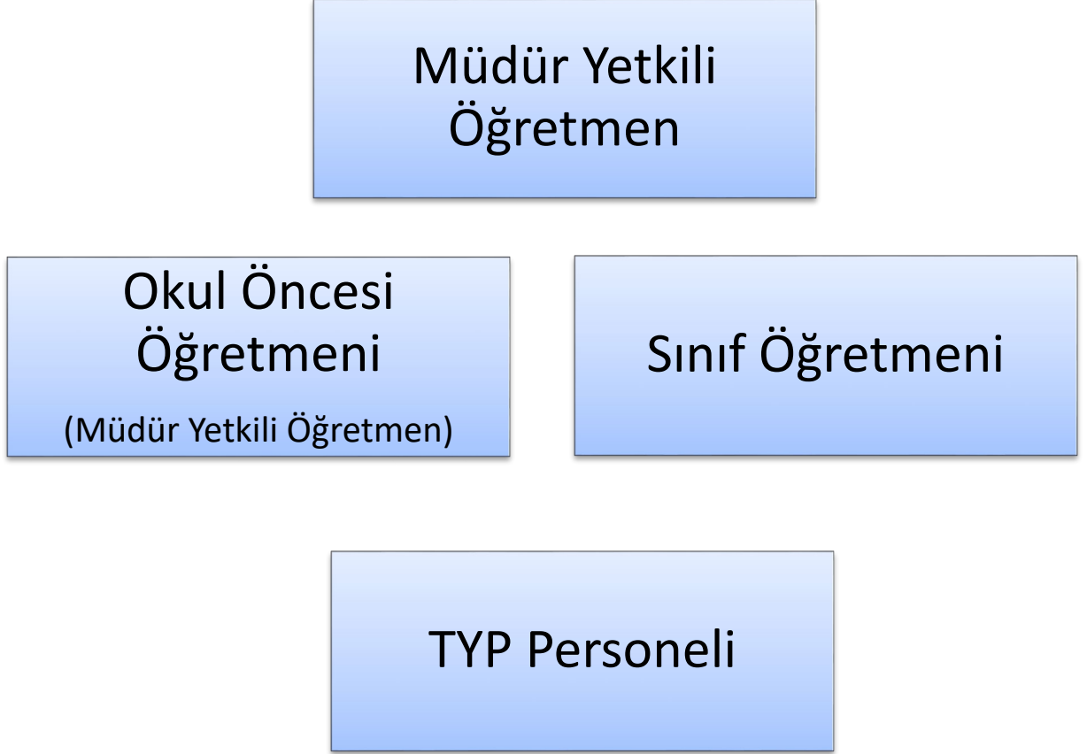
Şekil 1:Teşkilat Yapısı